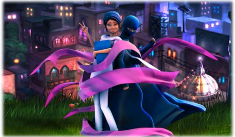
Superheldin in schwarzer Burka: Jiya bekämpft das Böse