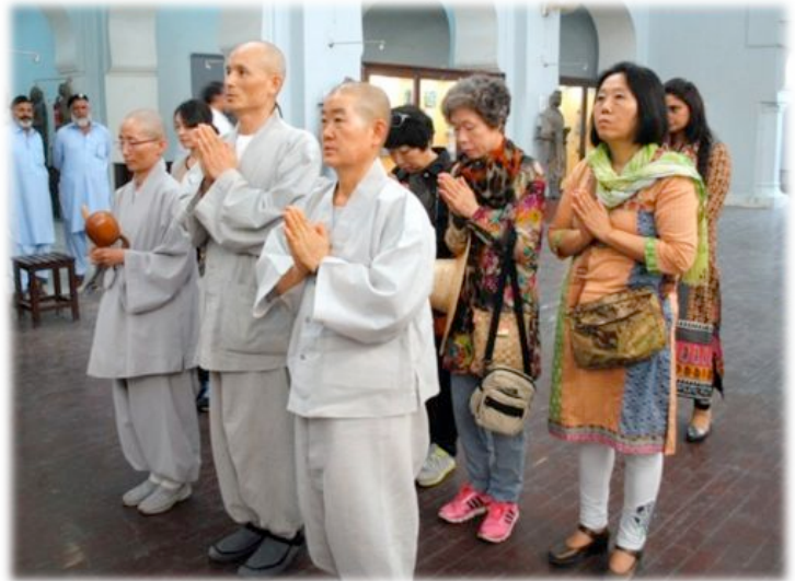
Nach 1500 Jahren der Stille - Mönche aus Südkorea zu Gast im Kloster Jaulian

HARIPUR - 1500 Jahre war der Ort fast still, nur die Geräusche der gelegentlichen Besucher und das Blätterrauschen waren zu hören. Jetzt kam wieder Leben in das Kloster Jaulian. Buddhistische Mönche sangen zum ersten Mal wieder an dieser heiligen Stätte - seit der Zerstörung im 5. Jahrhundert durch die Hephthaliten (bekannt als die Weißen Hunnen). Eine Gebetszeremonie für den Frieden wurde von der Khyber Pakhtunkhwa (KP) Direktion für Archäologie an einem der prominentesten buddhistischen Stätten im Land genehmigt. Das Ritual begann bei Sonnenuntergang und die Mönche aus Südkorea opferten Weihrauch, Licht, Wasser, Blumen, Obst und Reis.